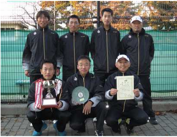
男子優勝: 栃木県庁 A