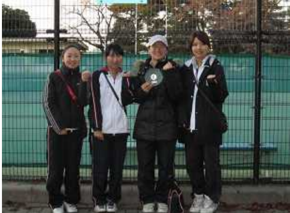
女子第3位: 本田技術研究所