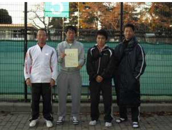
男子第4位: 足利銀行 A