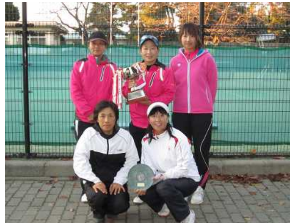
女子優勝: 栃木県教職員