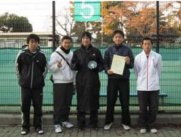
男子第3位: ホンダエンジニアリング A