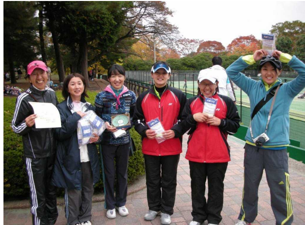
女子第3位: 栃木県庁