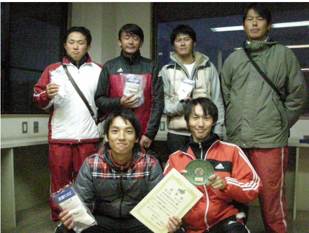
男子第3位: 本田技術研究所 A