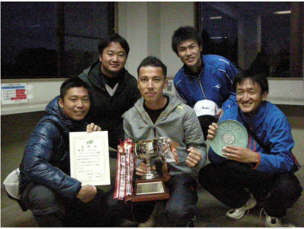
男子優勝: ホンダエンジニアリング A