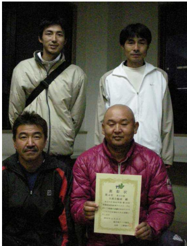
男子第4位: 日産自動車