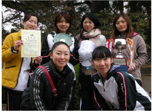
女子優勝: 本田技術研究所