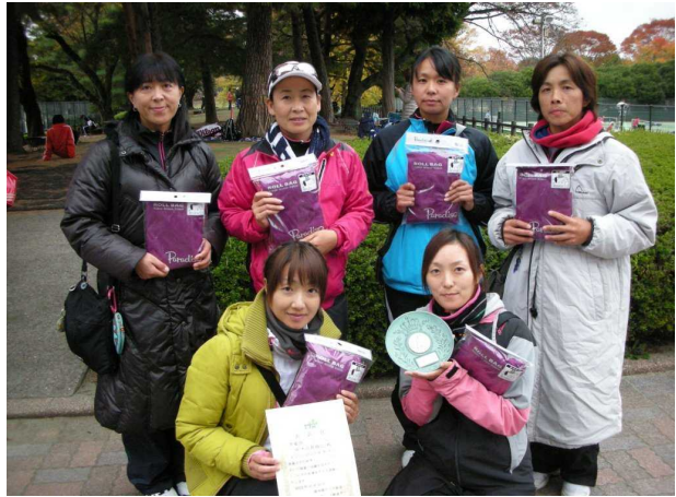
女子準優勝: 栃木県教職員