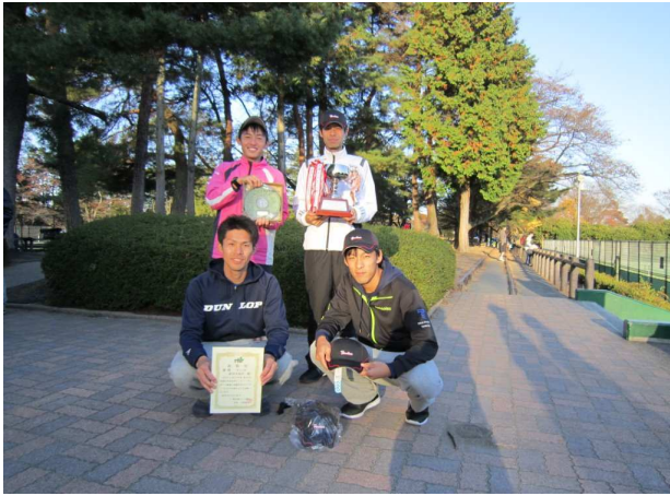
男子優勝: 鹿沼市役所