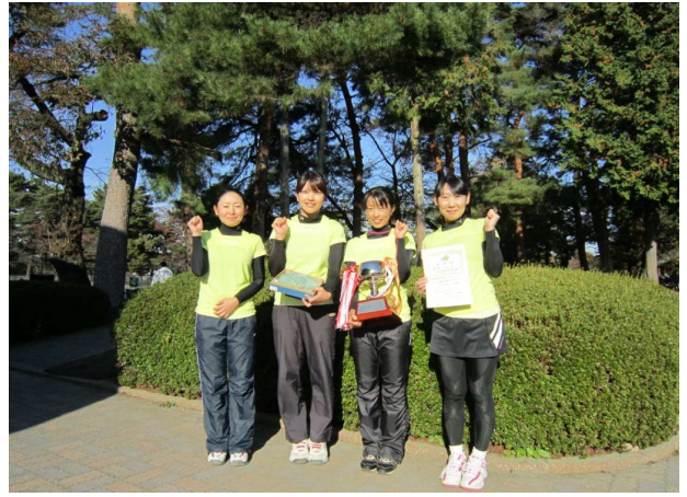
女子優勝: 本田技術研究所