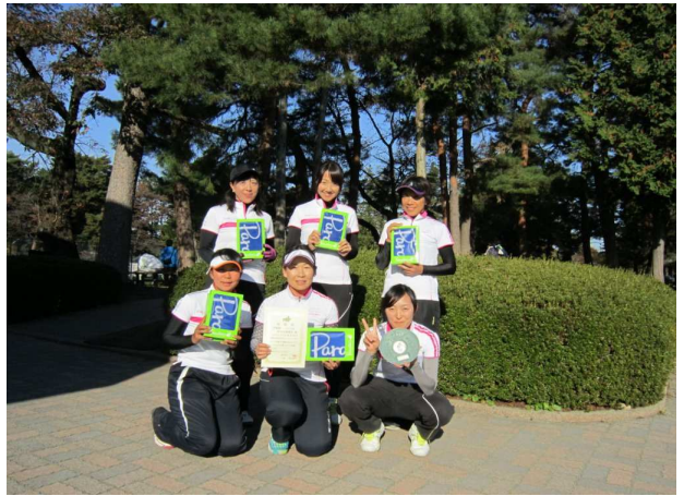
女子準優勝: 栃木県教職員