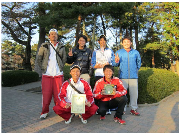
男子第3位: 本田技術研究所A