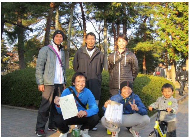
男子第4位: ホンダエンジニアリングA