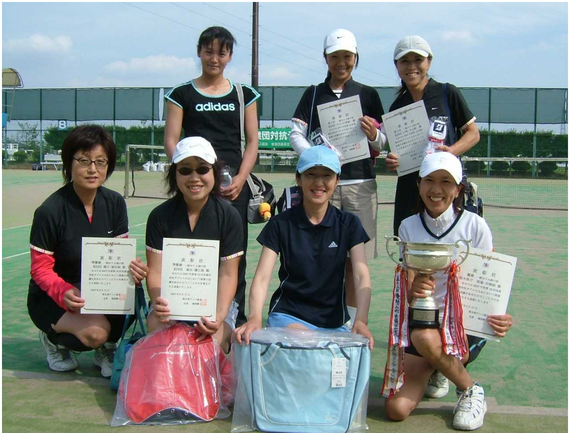
一般女子A級参加者一同