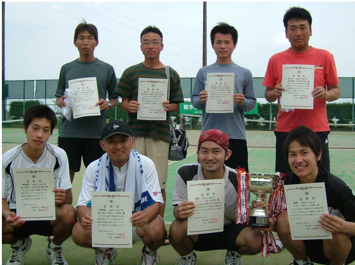
一般男子A級ベスト4入賞ペア