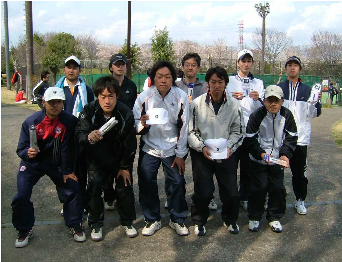
一般男子C級参加者一同