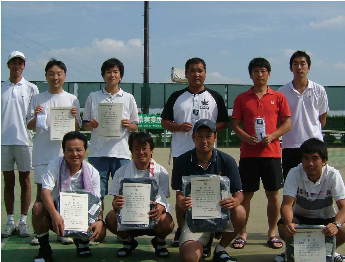
一般男子B級参加者一同