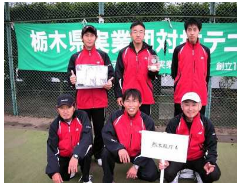
男子準優勝: 栃木県庁 A