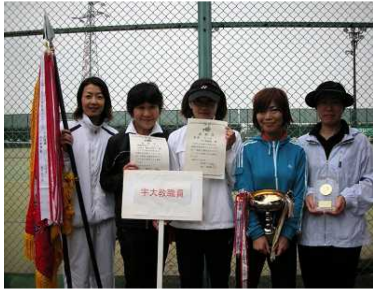
女子優勝: 宇大教職員