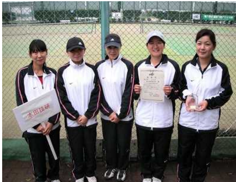
女子第3位: 本田技術研究所