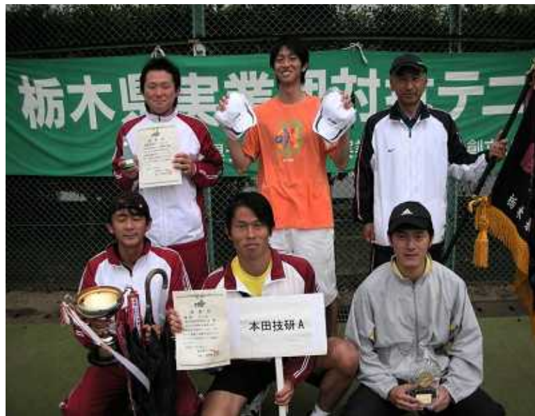
男子優勝: 本田技術研究所 A