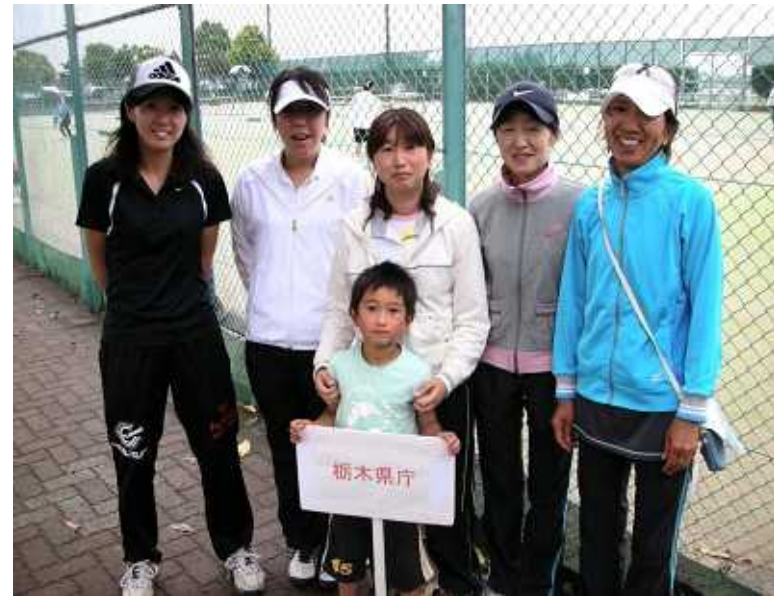
女子準優勝: 栃木県庁