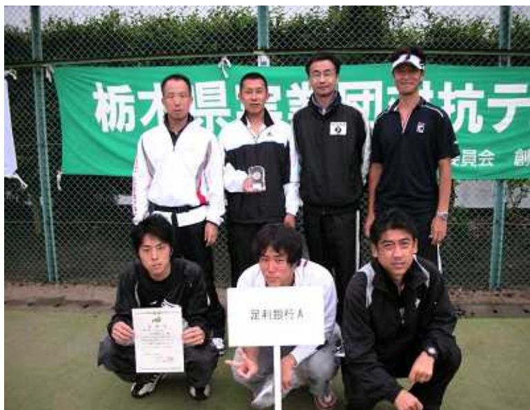
男子第3位: 足利銀行 A