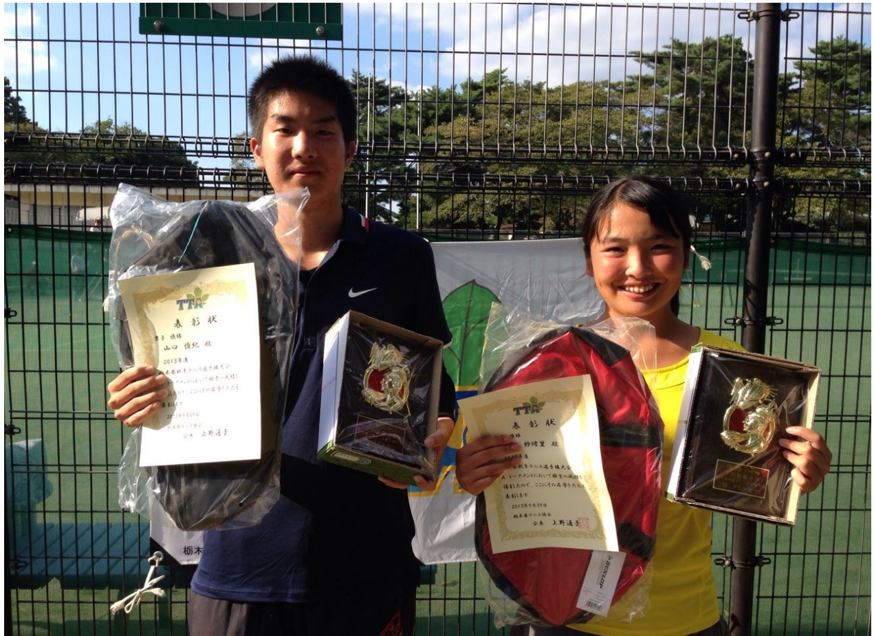
Aトーナメント 男子優勝：山口選手 女子優勝：山口選手