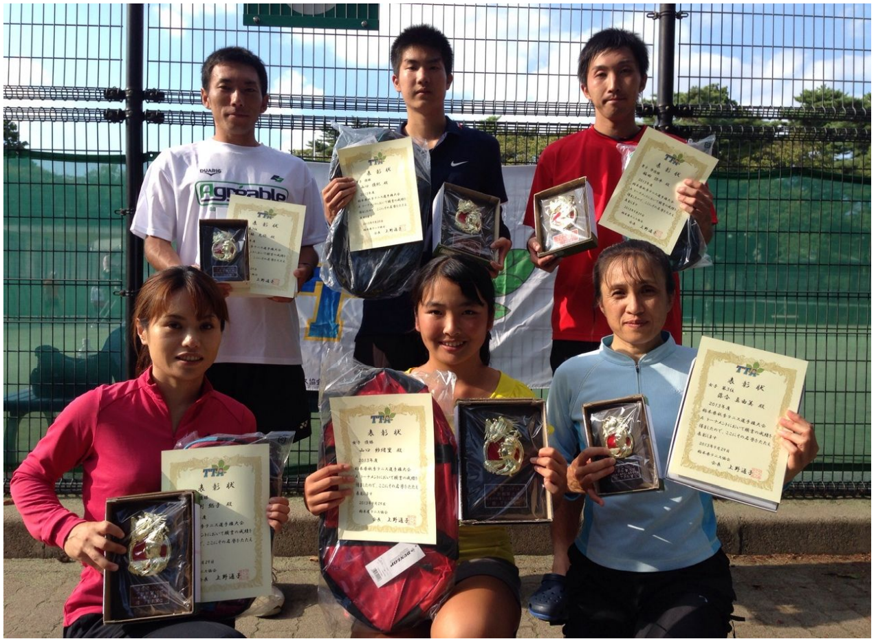
トーナメント 男女ベスト4入賞選手