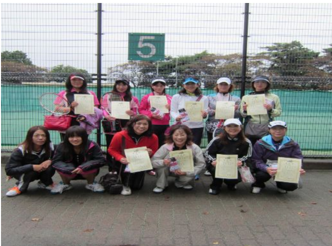
BT 女子各ブロック優勝者