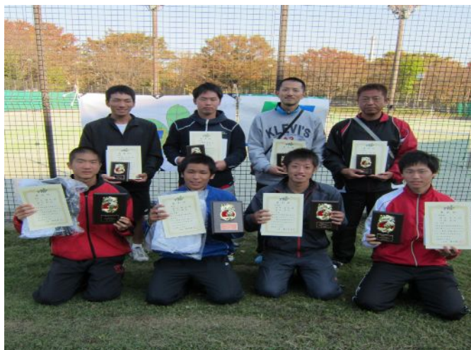
AT男子ベスト4入賞者