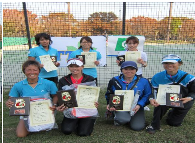
AT女子ベスト4入賞者