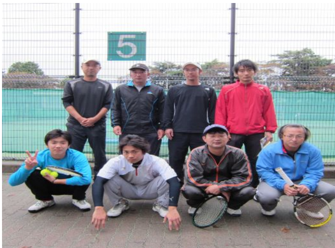
BT 男子各ブロック優勝者