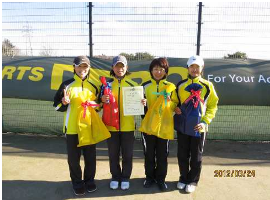
女子準優勝 ラフェスタ