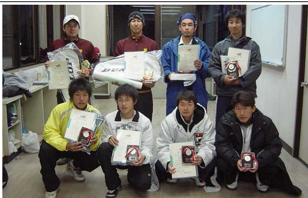
2008年度 男子ベスト4の選手

期 日 2010年1月24日(日)・1月31日(日) 予備日 2月6日(土) 屋板運動場(宇都宮市) ← 変更 会 場 栃木県総合運動公園 主 催 (株)ケイ・エル・エス 栃木県テニス協会 協 賛 (株)ダンロップスポーツ ユニティダイワ(株) 下野新聞社(株) 丸菱産業(株) 関東エコリサイクル(株) 主 管 栃木テニス協会