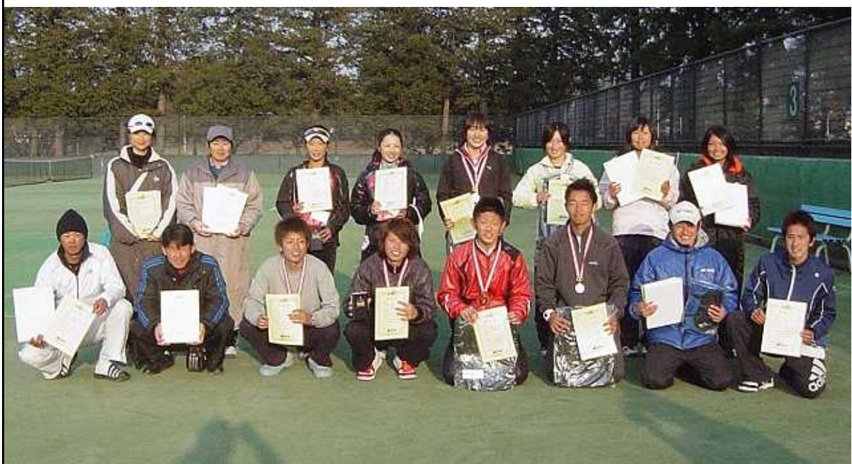
2009年度 ベスト4の選手

期 日 2011年1月23日(日)・1月30日(日) 予備日 2月6日(日) 栃木県総合運動公園 会 場 栃木県総合運動公園 主 催 (株)ケイ・エル・エス 栃木県テニス協会 協 賛 (株)ダンロップスポーツ (株)ケイ・エル・エス 下野新聞社(株) 主 管 真岡テニス協会