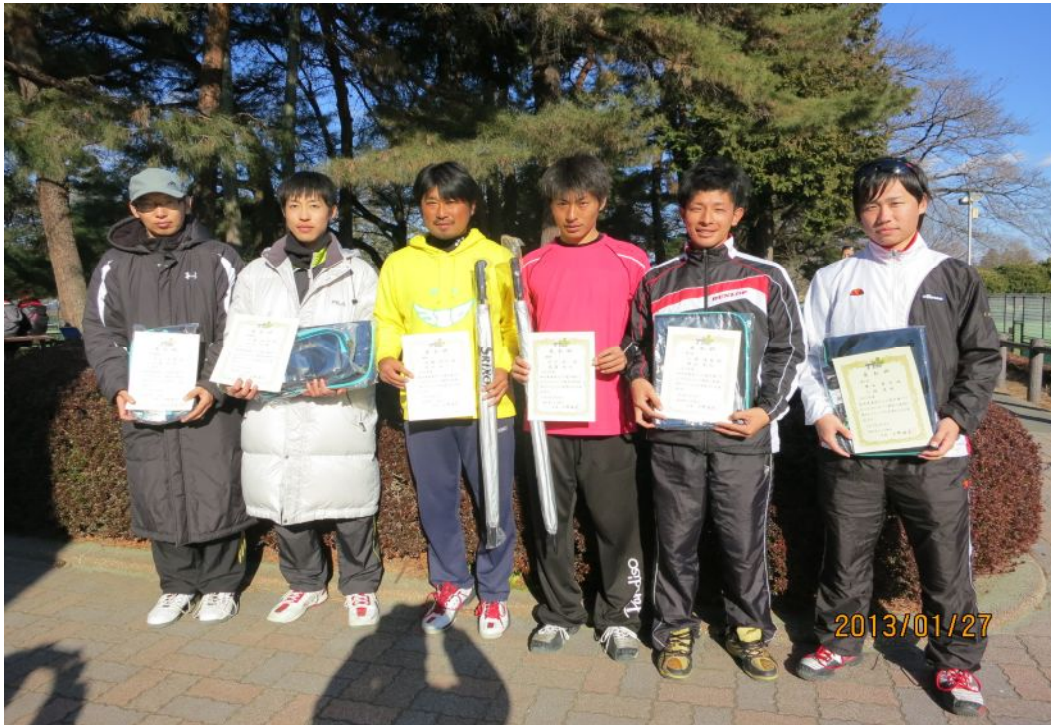
男子ベスト4入賞選手