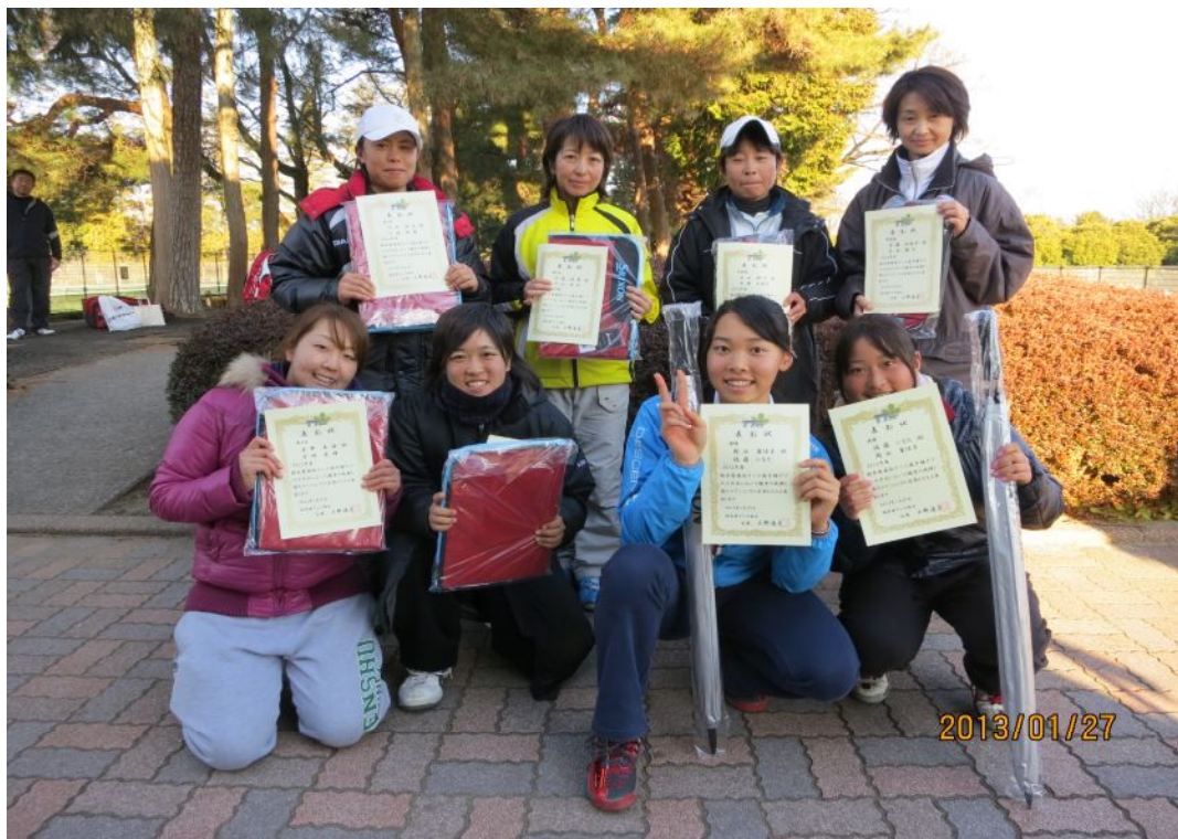
女子ベスト4入賞選手