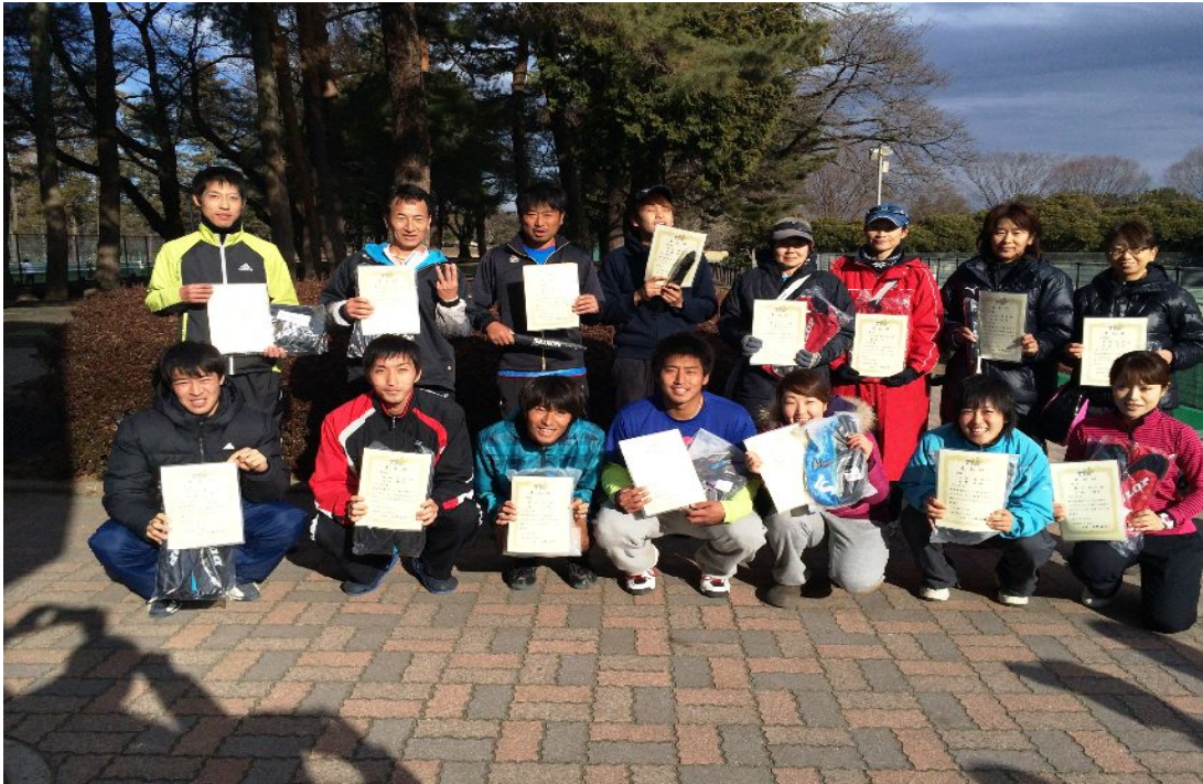
男女ベスト4入賞選手