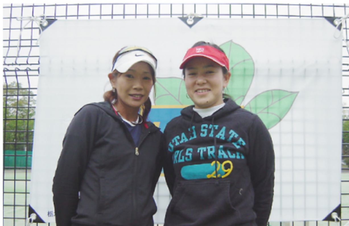
女子ダブルス 優勝