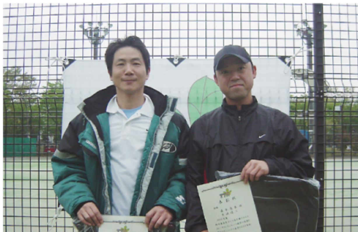
男子ダブルス 優勝