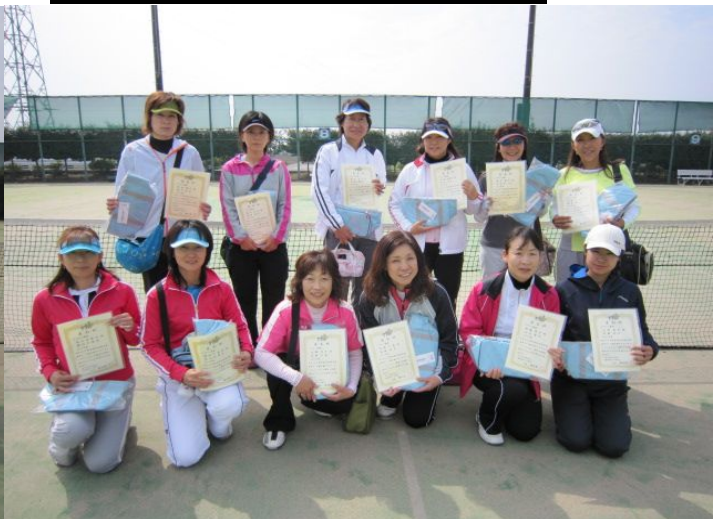
女子Bトーナメント各ブロック優勝