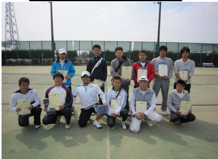
男子Bトーナメント各ブロック優勝