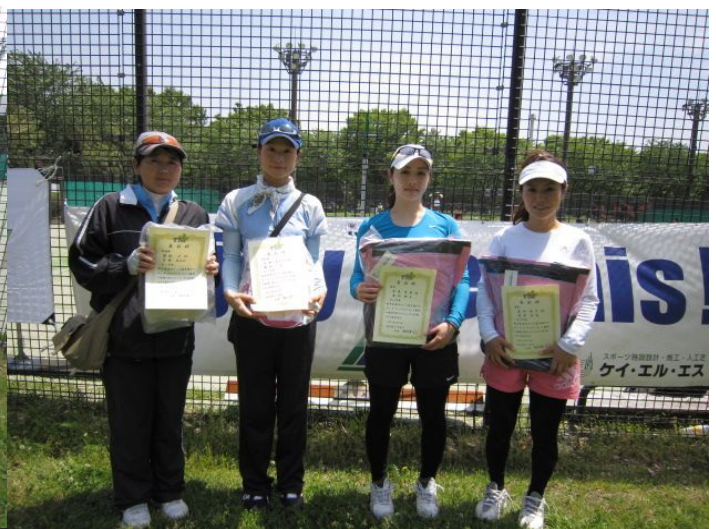
女子トーナメント優勝・準優勝