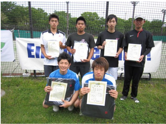
男子トーナメントベスト4入賞