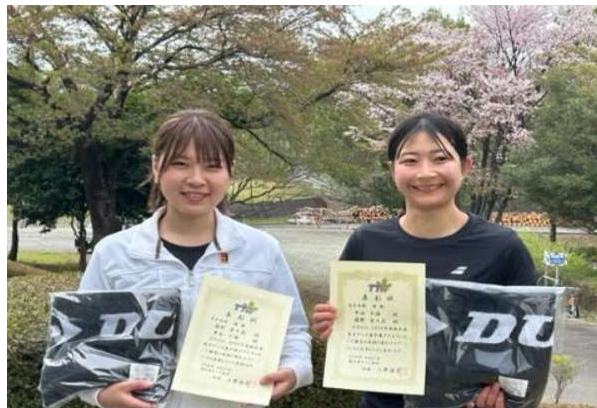
女子 優勝 瀧野・中山