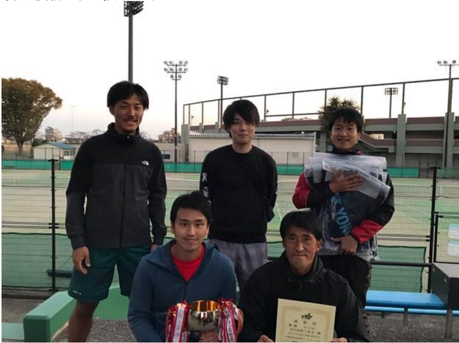
男子準優勝本田技研工業B