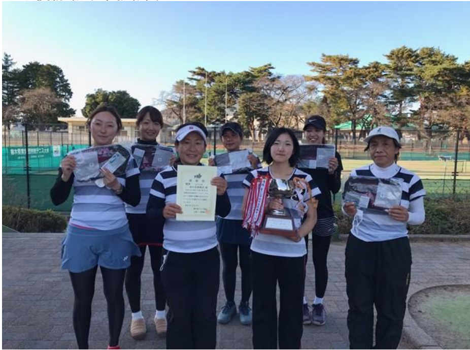
女子準優勝 本田技研工業