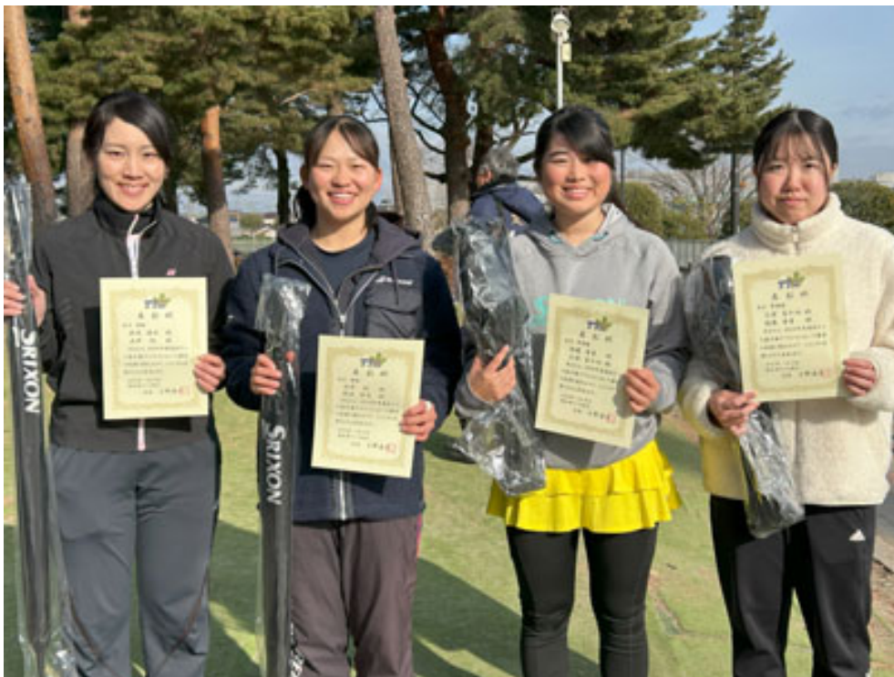
女子優勝・準優勝