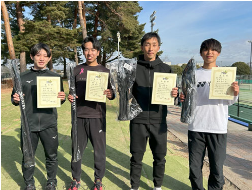
男子優勝・準優勝