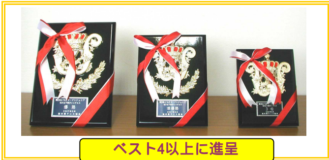
ベスト4以上に進呈