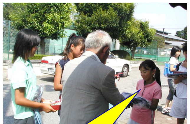
井村理事長からの賞品授与 とても嬉しそうです!!